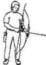
3. Main tireuse