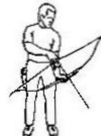
4. Main porteuse