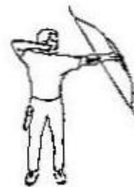
10. Analyse et relaxation